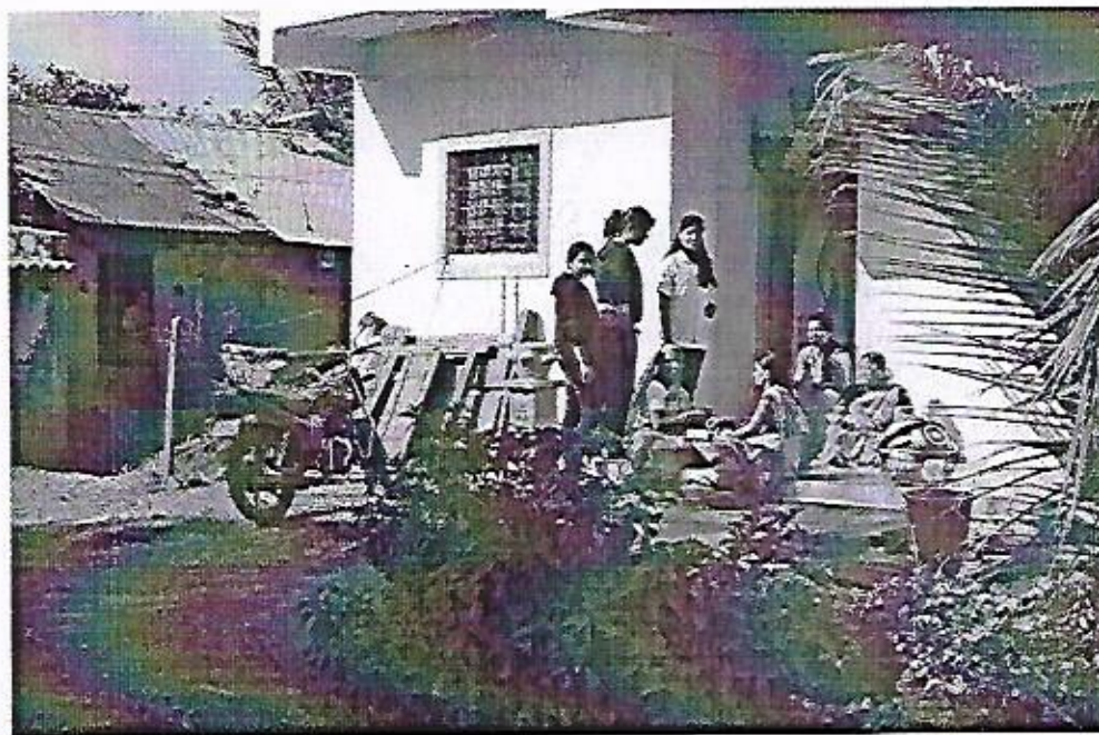
Mahila Arogya Janjagriuti Mohim

PRINCIPAL PUNE DISTRICT EDUCATION ASSOCIATION'S SETH GOVIND RAGHUNATH SABLE COLLEGE OF PHARMACY, SASWAD TAL. PURANDAR DIST. PUNE-412301.