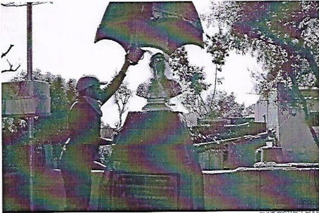
Cleaning of Chatrapati Shivaji Maharaj Smarak