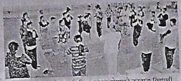
कुंभारवळण (ता. पुंर) : शिबिरादरम्यान योगासने करताना विद्यार्थी

गणेश, ता. ६ : पुणे शिबिर शिबिराचे उद्घाटन करण्यात आले. शिविराचे उद्घाटन करताना शिबिराचे उद्घाटन करताना शिबिराचे उद्घाटन करताना